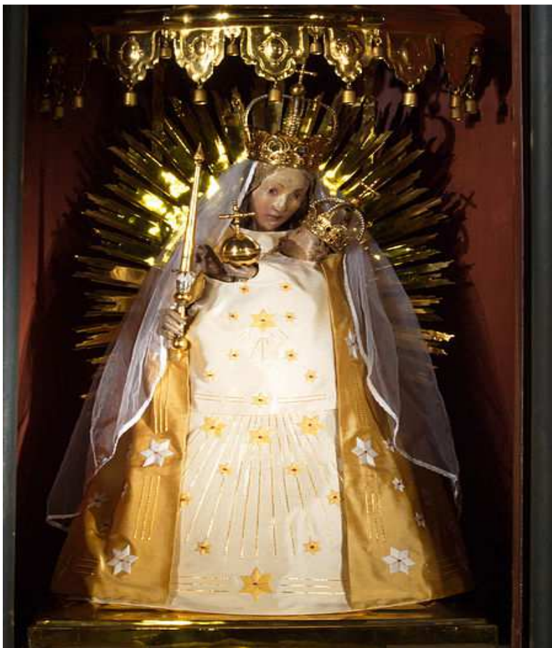
Gnadenbild von Verne