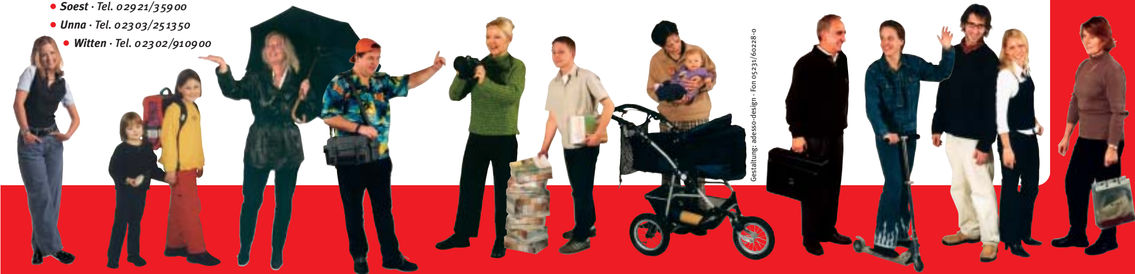
Gestaltung: adesso-design · Fon 05231/60228-0